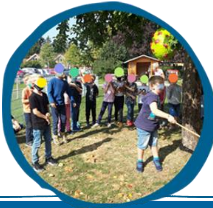
Corona-Piñata , OGS Nordkirchen